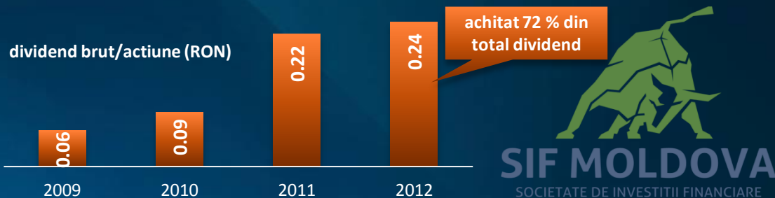
dividend brut/actiune (RON)

SIF MOLDOVA SOCIETATE DE INVESTITII FINANCIARE