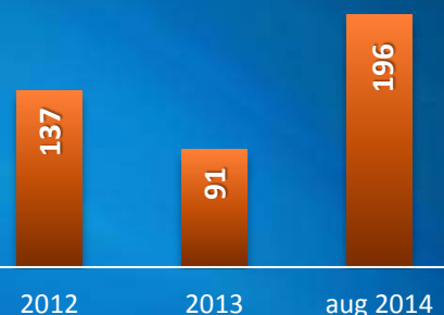
profit net (mil RON)